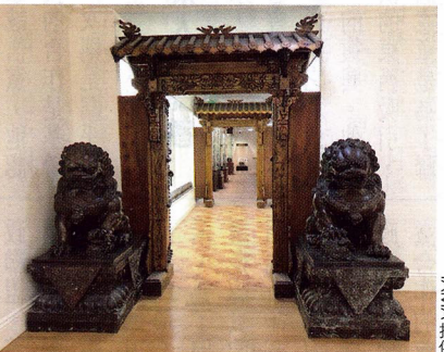
國際藝術館的室內設計有濃厚的東方文化氣息

杜英慈於台灣輔仁大學畢業，考上公費留學到美國深造，她認為藝術各種具象抽象技法最終還是為了提升無形精神境界，如前中央研究院院長胡適形容佛教經典《維摩詰經》是「最美的佛典文學」，佛法是「無形」的，卻以文學形式流傳於世，而維摩詰居士則是淨土金粟如來「化身」有