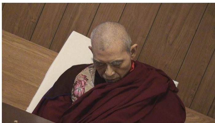
祿東贊法王生死自由，在預告的時間圓寂